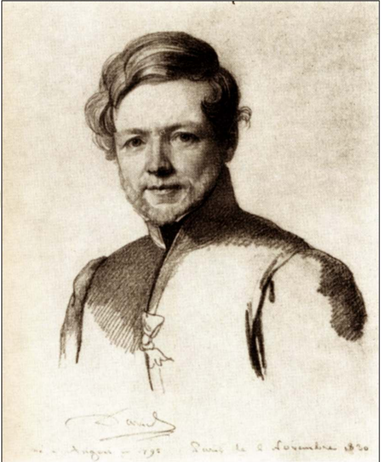
Pierre-Jean David d'Angers (1788-1856) in 1830 by: Carl Christian Vogel von Vogelstein (1788-1868)